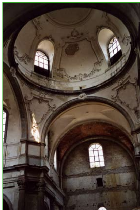
Photo 3 : vue intérieure de l'ancienne abbatiale de Baume-les-Dames

Les chapitres nobles offrirent tous au XVIII e siècle un plan caractéristique qui marque encore de nos jours le paysage, puisque la plupart des maisons canoniales, aux façades élégantes et sobres, datant généralement du XVIII e siècle, ont survécu. À cette époque, ces demeures agrémentées d'un jardinet, parfois dotées d'un édifice contigu ou annexe, telle qu'une écurie, se distribuaient autour d'une cour rectangulaire (photo 4) et de l'église, dans une disposition conçue pour contrôler plus efficacement les moeurs et pour limiter les déplacements à l'office divin. Quelques bâtiments, églises et demeures, rappellent donc encore discrètement dans l'urbanisme de la Comté le souvenir d'une institution qui fut constitutive de son identité et joua un rôle non négligeable dans l'histoire de la noblesse et de l'Église ■