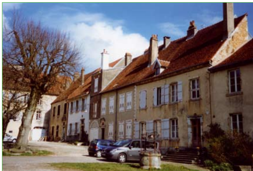
Photo 4 : anciennes maisons canoniales du XVIII e siècle à Montigny-lès-Vesoul