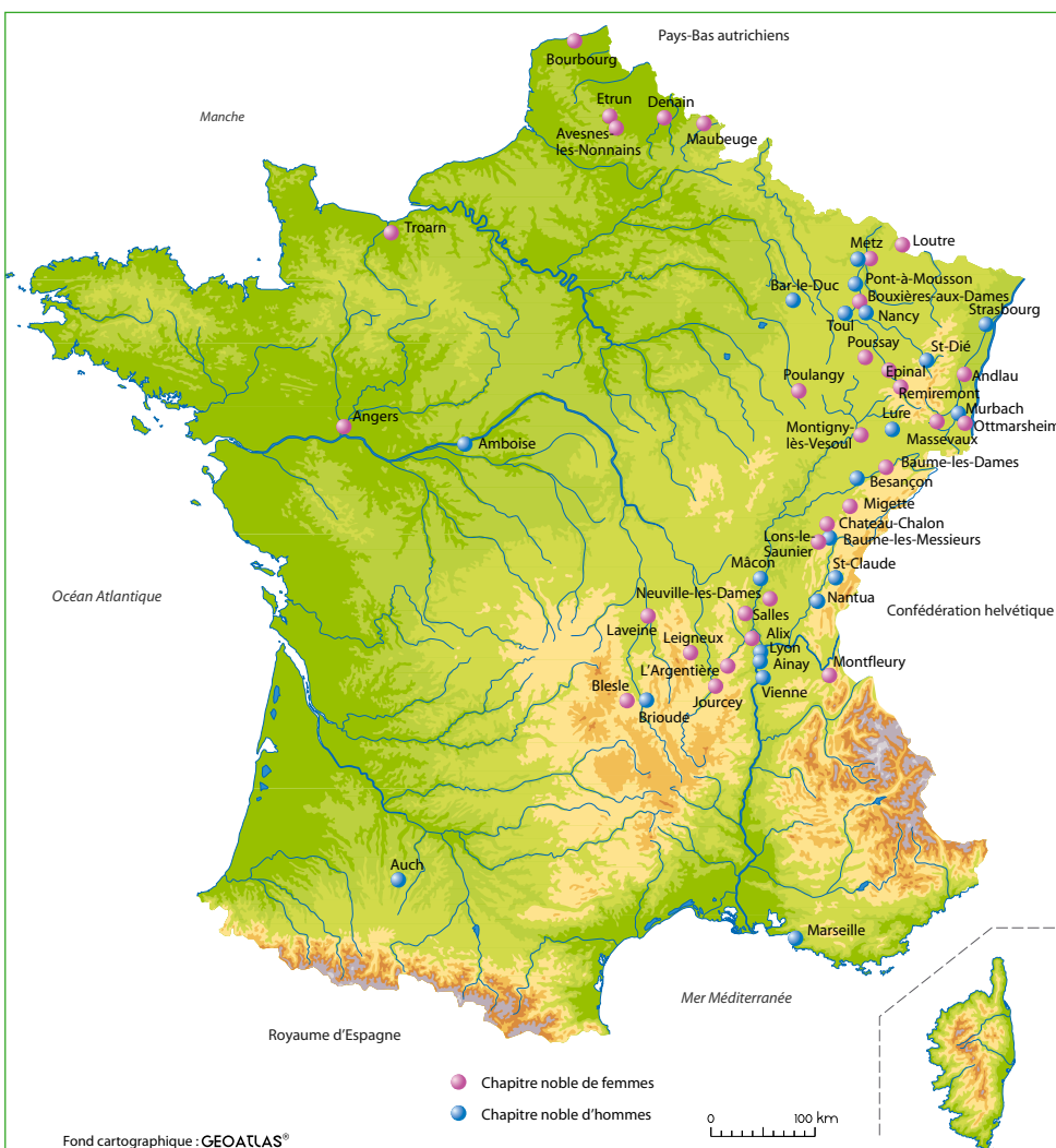
Figure 1 : les chapitres nobles dans le royaume de France en 1789

En Comté comme ailleurs, le siècle des Lumières apparaît comme l'âge d'or de cette institution, parce qu'elle répondait de plus en plus à une fonction sociale : ces « hôpitaux de noblesse », comme on se plaisait souvent à les appeler au XVIII e siècle, suppléaient en effet les difficultés pécuniaires de la petite noblesse provinciale d'extraction, accueillant ses cadettes écartées d'un mariage faute d'une dot. Femme de lettres, madame de Chastenay, reçue au chapitre d'Épinal en 1784, nous éclaire dans ses Mémoires sur leur fonction : « l'institution était belle et l'on peut dire en toute