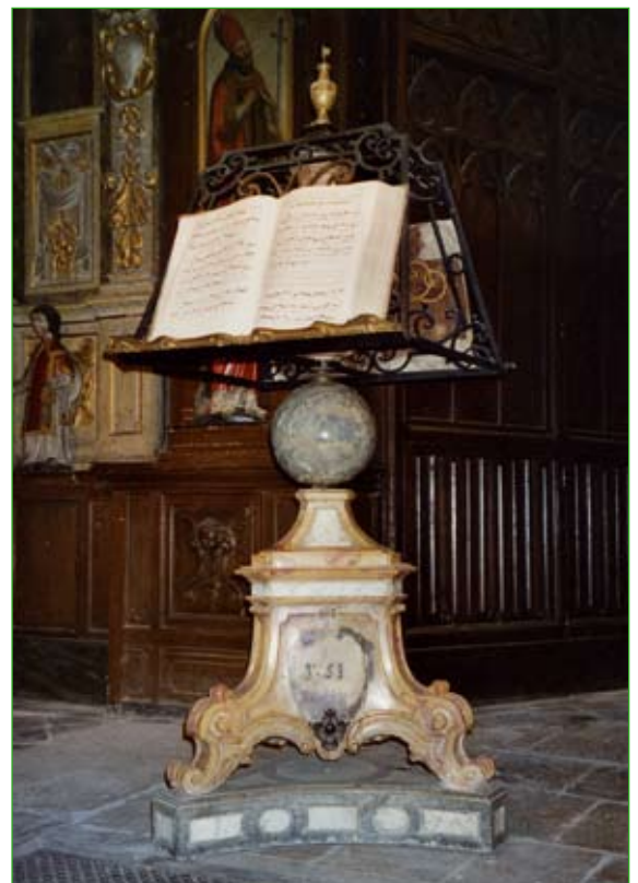
Photo 2 : le lutrin de marbre dessiné par l'architecte Nicolas Nicole pour les dames de Baume en 1751, illustre l'importance du chant choral dans les chapitres nobles (église Saint-Martin de Baume-les-Dames)