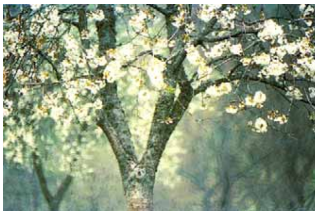
Cerisier en fleurs à Fougerolles

C'est dans cette dernière zone que se situent les principales activités industrielles, issues d'une tradition ancienne. Chaque village a ses ateliers et ses usines avec souvent des spécialités qui ont connu depuis 20 ans des fortunes diverses. Les traditions métallurgiques qui ont fait autrefois la renommée de Corbenay et d'Aillevillers (forges de la Branleure et de la Semouse) perdurent avec difficultés ou ont été converties. Le textile-habillement à Fougerolles, Fontaine et Saint-Loup a connu bien des vicissitudes, et bon nombre d'usines ont dû fermer. Fougerolles a su maintenir et développer un renom dans le domaine de la distillerie,