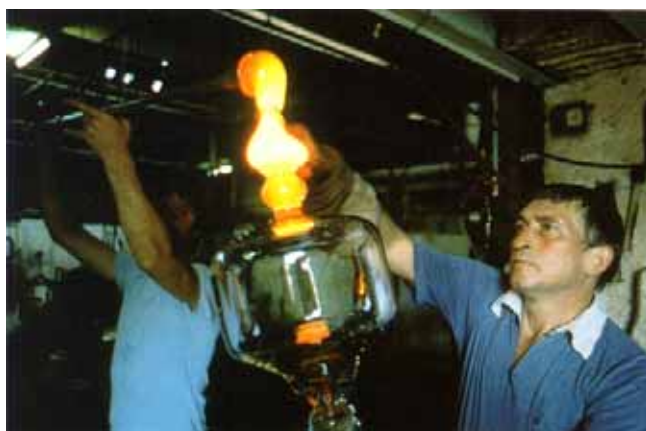
Le travail du verre à Passavant-la-Rochère

Mais la principale activité pourvoyeuse d'emplois reste le travail du bois, même si ces dernières années ont connu une baisse des effectifs. L'entreprise Parisot, avec près d'un millier d'emplois, est un des plus grands fabricants français de meubles de série ; elle fait de la petite ville de Saint-Loup une capitale européenne du meuble. Les autres cantons sont, eux, bien dépourvus d'industries : quelques ateliers de travail du bois à Corre et à Jussey, quelques laiteries, une verrerie renommée à Passavant-la-Rochère, une importante tréfilerie à Conflandey en composent l'essentiel.