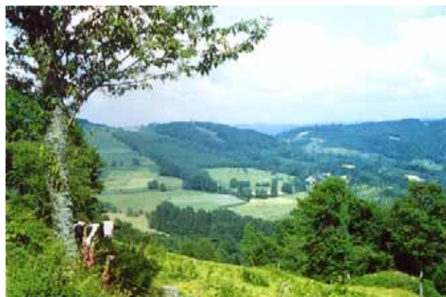
Vallonements haut-saônois

particulier dans l'importance et la localisation des forêts. Le cloisonnement topographique de la haute vallée de la Saône se retrouve dans l'organisation des paysages végétaux, opposant collines boisées et dépressions largement cultivées ou couvertes de prairies. Au contraire, dans les pays de la Semouse, la forêt, présente sur les hauteurs, s'est également maintenue en de vastes secteurs de plaine, sur des sols pauvres issus d'épandages fluvio-glaciaires d'origine vosgienne. Les terroirs cultivés sont étroitement circonscrits à la périphérie de bourgades industrielles. Sur les grès vosgiens, plus à l'amont, la forêt s'aère de multiples clairières bocagères dans un cadre d'habitat dispersé.