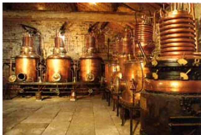
La distillation du kirsch à Fougerolles

peu connus et peu valorisés. Le principal atout est la vallée de la Saône, ouverte à une navigation de plaisance modeste mais en développement. Le canal de l'Est, avec ses nombreuses écluses, est fréquenté jusqu'à Corre par des péniches de croisière qui assurent des circuits réguliers avec attractions. Le pôle touristique majeur est constitué par Passavant-la-Rochère, ses ateliers de verrerie, son musée, ses boutiques de vente. Plus intégré au flux touristique est le secteur de Saint-Loup-Fougerolles, situé entre de grands centres de thermalisme et de séjour : Plombières, Luxeuil, Bains-les-Bains, et traversé par la Nationale 57 animée d'importants flux nord-sud. Fougerolles est devenu, par son industrie de bouche, un centre touristique attractif en pro-