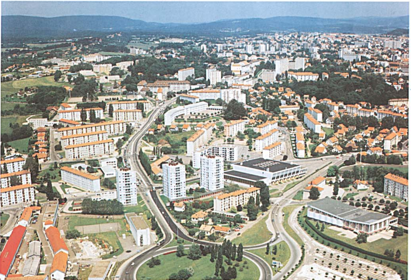
Le quartier de Montrapon en 1984

La crise économique du milieu des années 70 aggrave la situation, le nombre de chômeurs est multiplié, les revenus