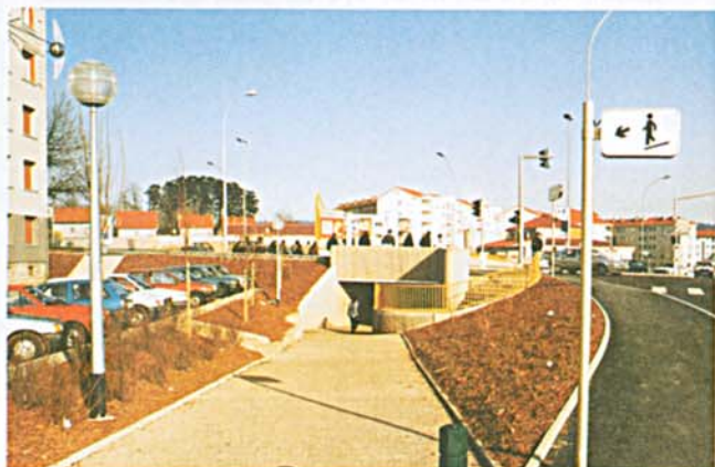
Le nouveau franchissement du boulevard W. Churchill

Ainsi, grâce aux travaux de réhabilitation du parc de logements sociaux et à la création d'un véritable cœur de quartier, le visage de Montrapon a été profondément modifié.