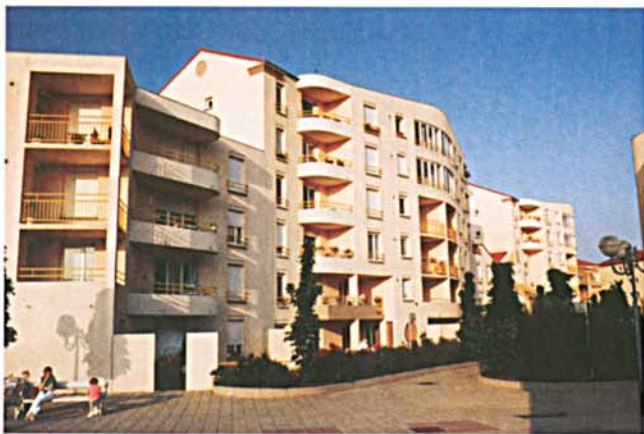
Les nouveaux bâtiments de la place P. De Coubertin