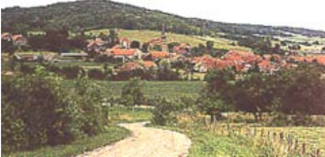
Le village de Charmes-Saint-Valbert noyé dans un paysage bucolique.

de la comparaison de clichés effectués à des périodes différentes-: les paysages marqués par les équipements et les constructions, les paysages gagnés par la friche, les paysages fermés par la forêt, etc.